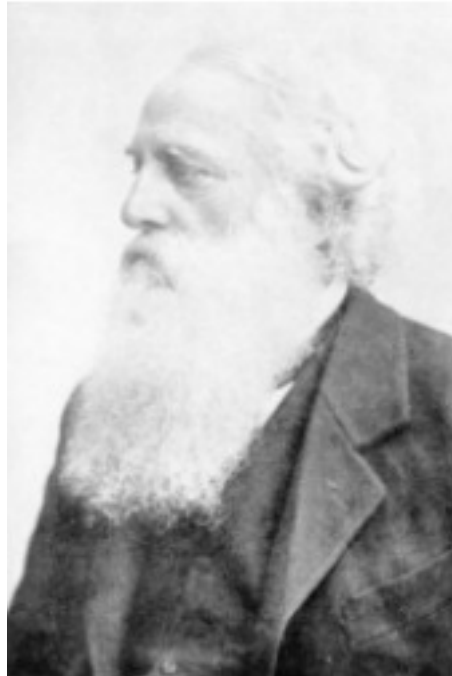
CORONEL HENRY STEEL OLCOTT (1832-1907)

Nuestros bondadosos críticos nos dicen: «¿No les basta que el mundo, a fuerza de ismos haya llegado al Teosofismo , que no es más que una charlatanería trascendental, sin que este último nos ofrezca una versión réchauffé de la magia medieval con su gran Sabbath e historia crónica?».