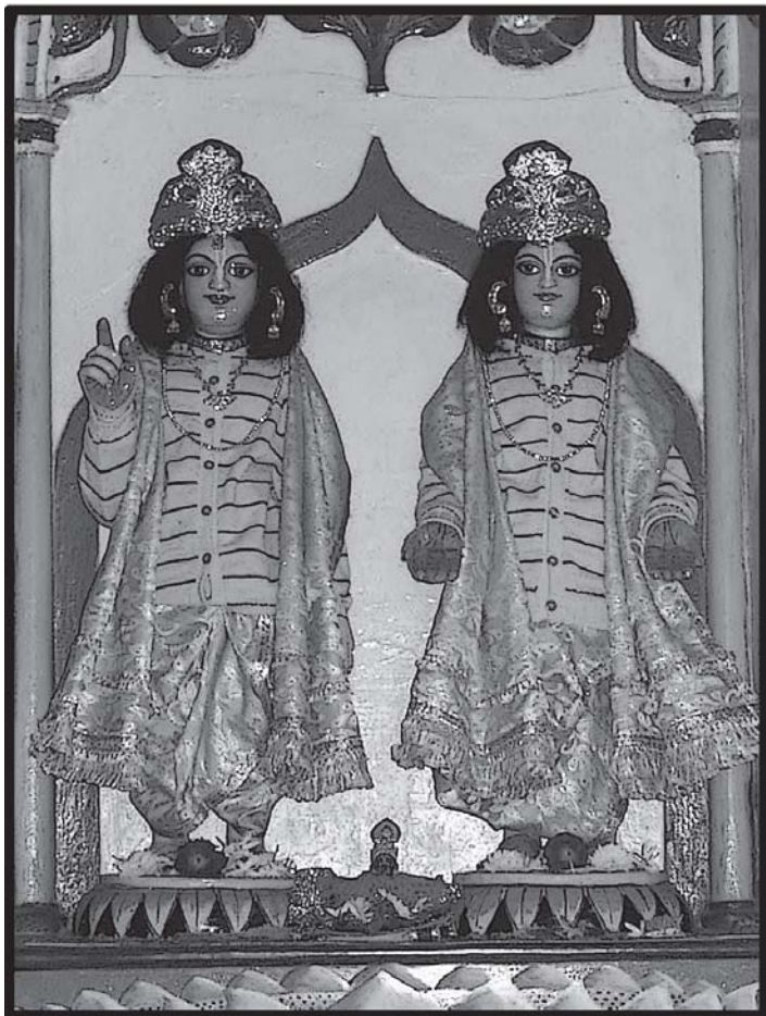
चम्पकहट्टमें सेवित श्रीश्रीगौर-गदाधर