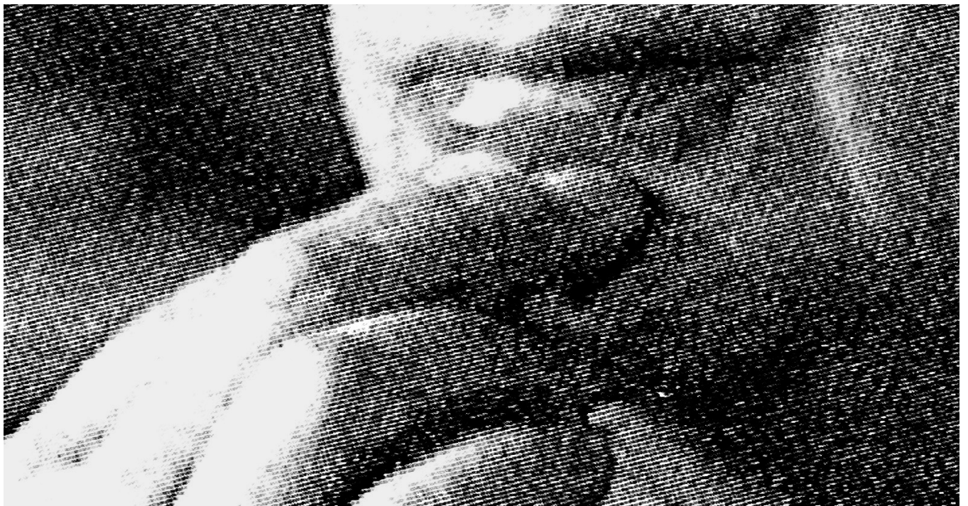
Roland Barthes 2: Roland Barthes.

Este fenômeno será detalhado através do que chama de Punctum , talvez a contribuição mais original e desconcertante deste livro.