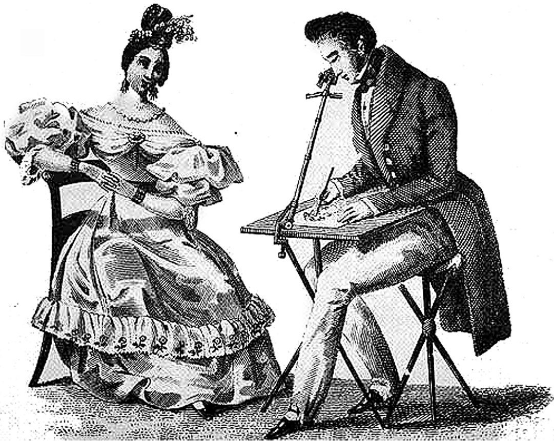
Camara Lucida. Anônimo, século XIX.

fotografias, as câmeras obscuras eram utilizadas para auxiliar o trabalho dos pintores e desenhistas. Por sua vez, câmara clara é mais que um trocadilho. Refere-se à camara lúcida , um aparelho surgido no início do século XIX, que permite, através de um prisma, ver simultaneamente o objeto que se deseja representar e a folha em que será feito o desenho. O efeito ótico de sobreposição permite ao desenhista copiar com facilidade os contornos do objeto no suporte. Barthes resgata esse aparato esquecido na história para dizer que a essência que encontra na fotografia não é de uma ordem profunda, íntima; ela está fora, no elemento exterior que através dela se evidencia (p.157).